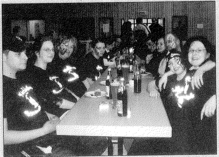
Auch die Kirchheimer Guggemusiker waren gekommen